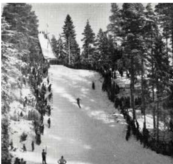
Utförsåkning i Hallbybacken, 1953