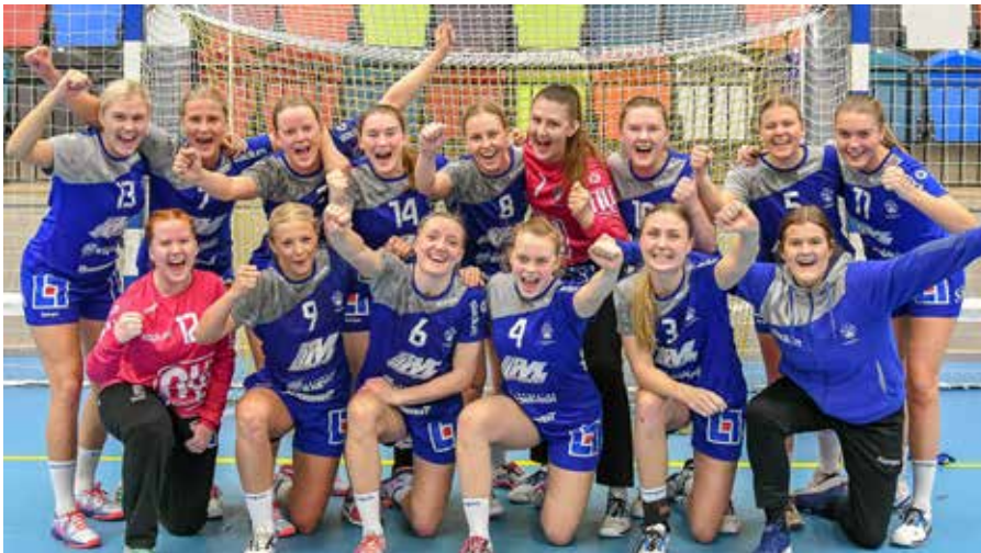
Hallbybollen samlar årligen, tusentals ungdomar till en handbollsfest i Jönköping (övre vänstra bilden).