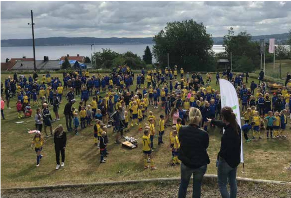
Ungdomsverksamheten har alltid haft en viktig plats hos Hallby. Sommarens fotbollsskolor har genom åren gett tusentals unga flickor och pojkar gemenskap, träning och för många ett första steg på vägen mot en bra fotbollskarriär.